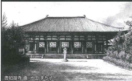
唐招提寺 画：池田 まち子