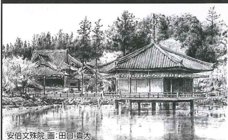
安倍文殊院 画：田回 貴大