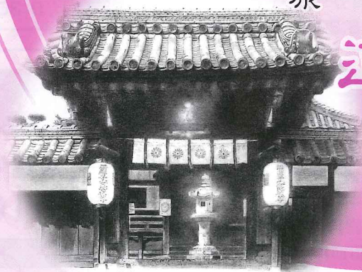
帯解寺 画:伊藤 俊