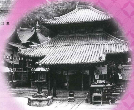
宝山寺 画:西田 弘英