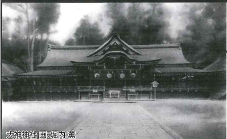
大神神社 画：堀内 薫