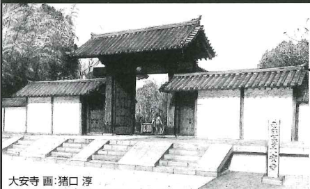
大安寺 画：猪口 淳