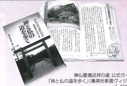
神仏霊場巡拝の道 公式ガイドブック 「神と仏の道を歩く」(集英社新書ヴィジュアル版) 1,400円(税込) 社寺の細密鉛筆画は、同書より転載

■旅行企画・実施/奈良交通株式会社 ■企画/奈良21世紀フォーラム ■後援/歴史街道推進協議会