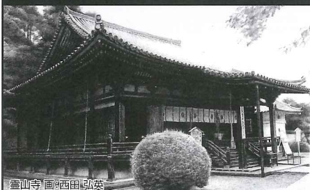
靈山寺 画：西田 弘英